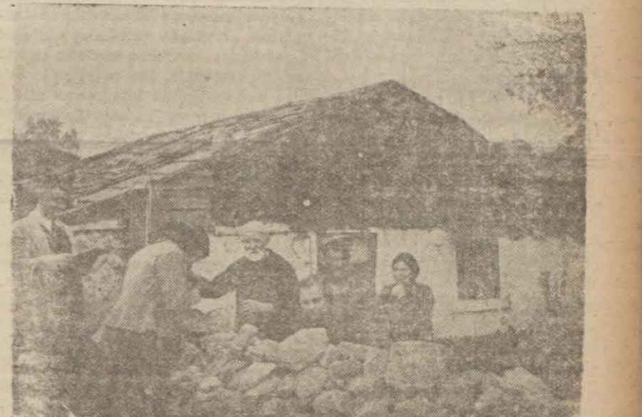
Kenar mahallelerde nüfus sayımından bir intiba Dün, her türlü huzuru, emniyeti ve güveni içine sindirmiş bir milletin en yüksek içtimai jestini yaptık. Dünya, barut dumanı içinde birbirini seçti.