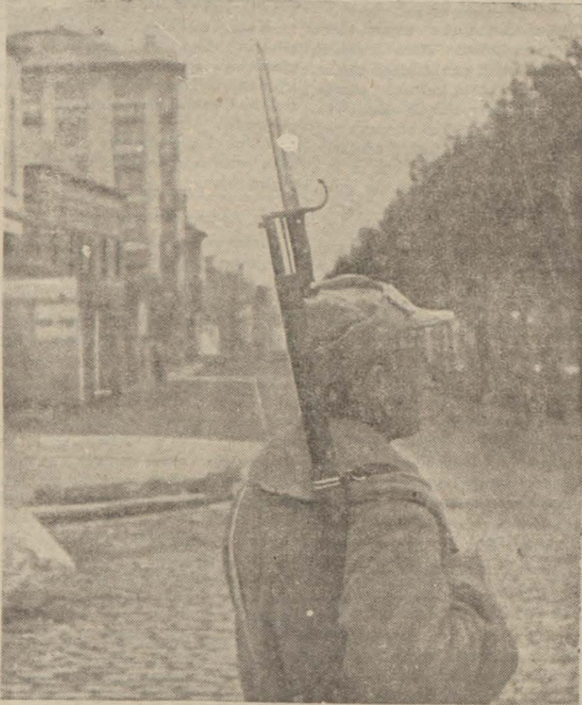
İstanbul sokaklarında Mehmedçik