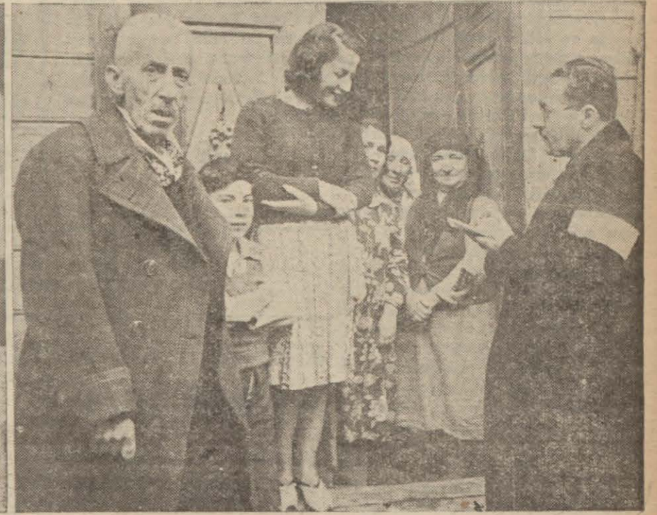
Dünkü nüfus sayımından intibalar: Solda köprüde izin kâğıdı tetkik edilirken, ortada dün Şişli ve Haseki hastanelerinde dünyaya gelen yavrular, sağda bir aile kaydedilirken